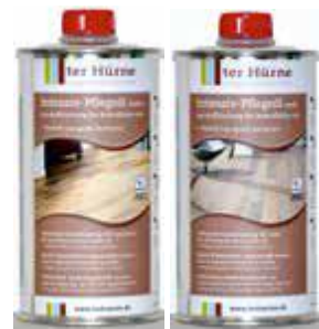
Olej do intensywnej pielęgnacji bezbarwny/biały Nr art. 1101060086/ 1101060087 Pojemność: 500 ml

Uwaga: Jeżeli ruch jest wyjątkowo duży, powierzchnię należy odnowić przy pomocy wykwalifikowanych parkieciarzy.